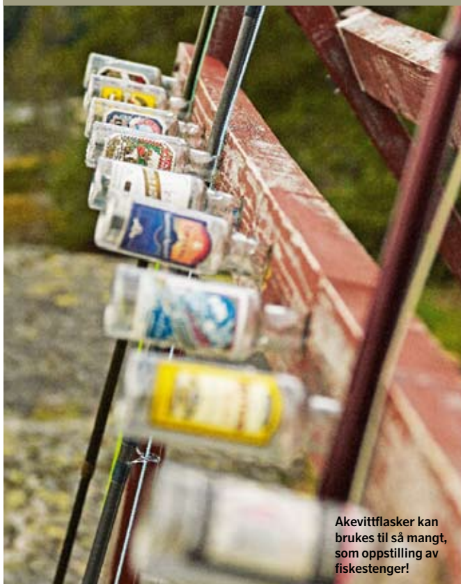
Akevittflasker kan brukes til så mangt, som oppstilling av fiskestenger!

– Dørsken. Så du den? Stemmen runger utover vannet. De to kvinnene i robåten øyner et lite håp etter å ha sett storlaksen hoppe.