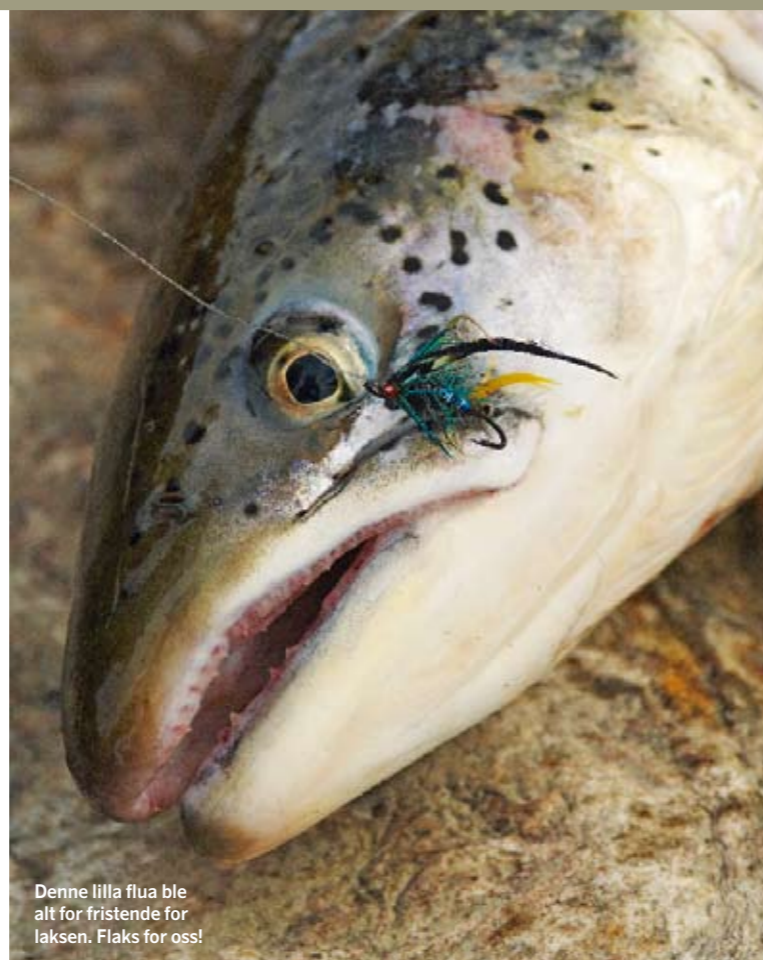
Denne lilla flua ble alt for fristende for laksen. Flaks for oss!

Historien forteller om en gjenganger i elva som hadde sket i 14 – orten – år uten å få sk. Og da snakker vi seriøst ske. Men så, plutselig, løsnet det. Hva mannen gjorde, er det ingen som vet, men den sommeren tok han seks stykker. >>