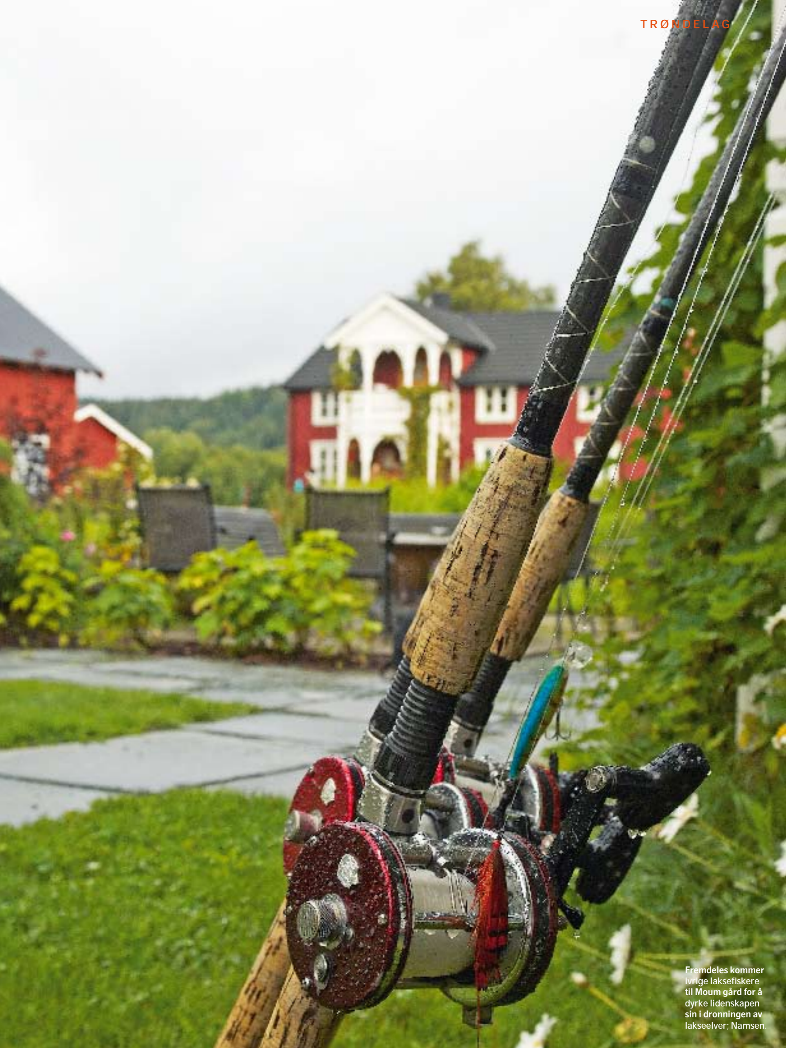
Fremdeles kommer ivrige laksefiskere til Moum gård for å dyrke lidenskapen sin i dronningen av lakselver: Namsen.