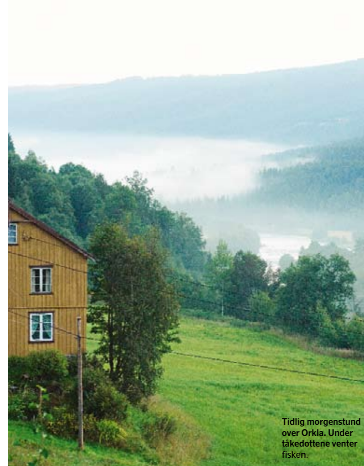
Tidlig morgenstund over Orkla. Under tåkedottene venter fisken.