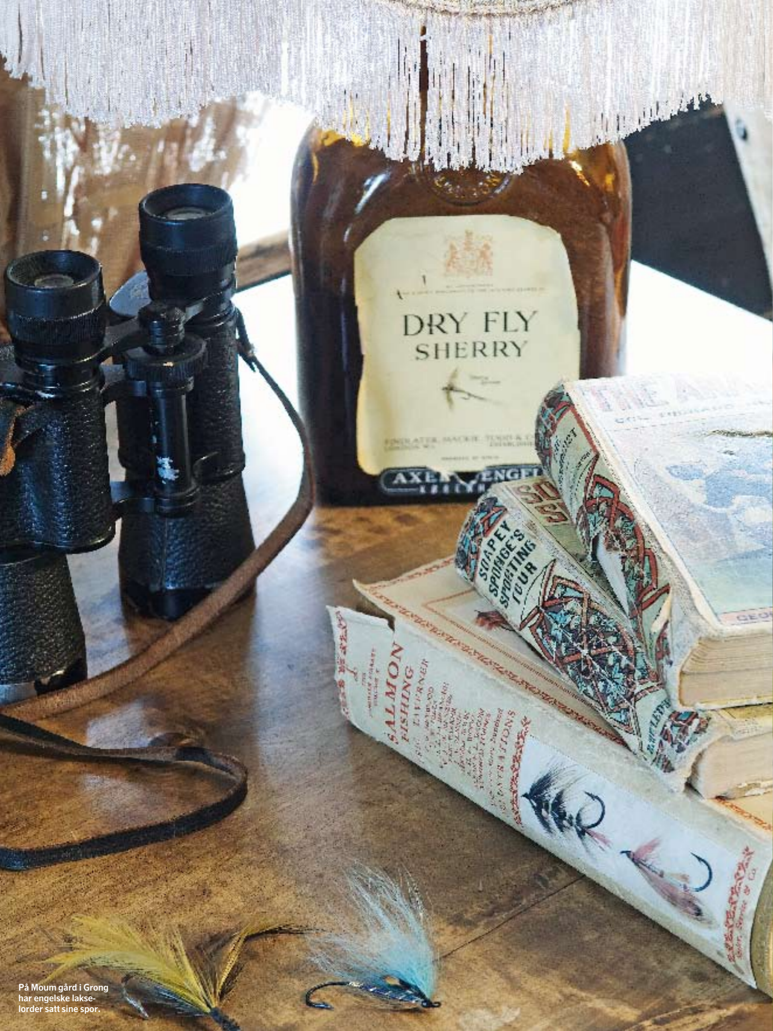
På Moum gård i Grong har engelske lakselorder satt sine spor.