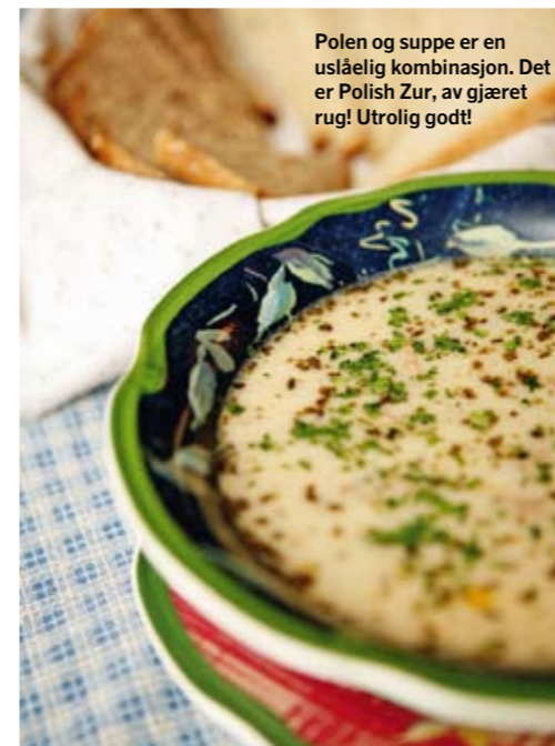
Polen og suppe er en uslåelig kombinasjon. Det er Polish Zur, av gjæret rug! Utrolig godt!