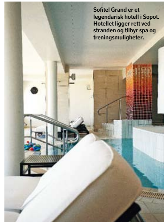
Sofitel Grand er et legendarisk hotell i Sopot. Hotellet ligger rett ved stranden og tilbyr spa og treningsmuligheter.