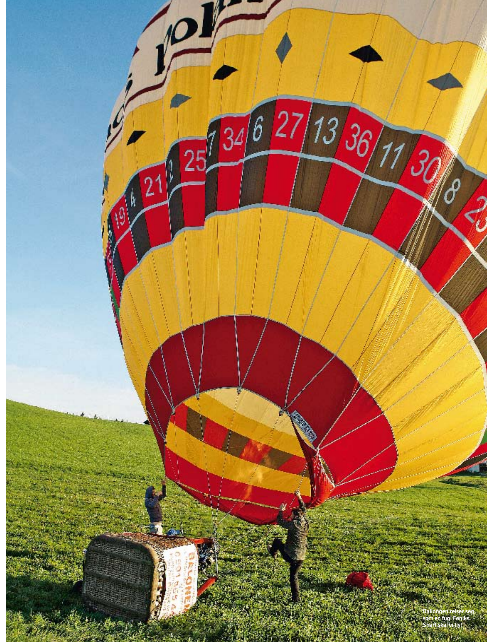
Ballongen reiser seg som en fugl Fønix. Snart skal vi fly!

Vi stønner og slår oss lett på magene. Vi har mesket oss med en fersk, saigkveitelet. Den var akkurat passe stekt, med hvitt og fast skekjøtt. Tilbehør? En sitronbåt. Genialt enkelt og genialt godt, en liten fatøl, og måltidet er komplett. Vi er ikke alene, Bar Przystań er tydelig et populært sted. De lokale, fargerike skebåtene ligger rett nedenfor og sikrer fersk fangst hver dag. Mens de spreke studentene fra Gdansk fortsetter strandvolleyballtreningen, nner >>